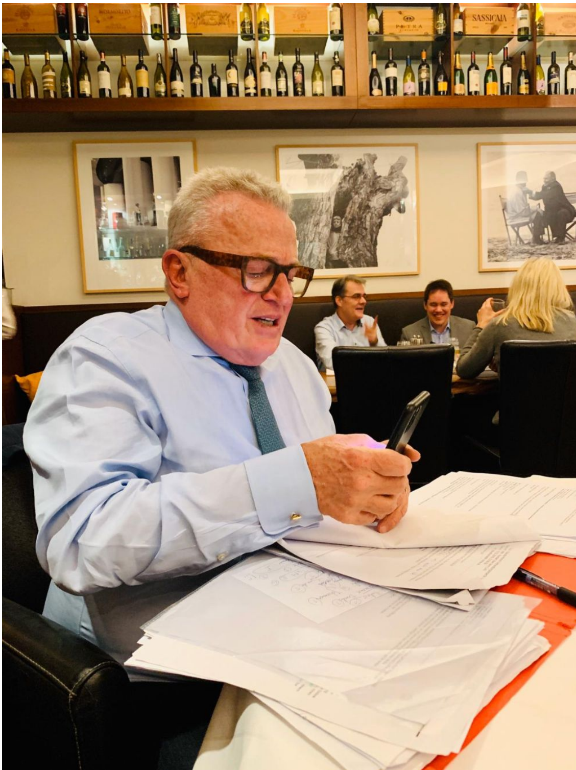
Berliner Abende: Arbeiten, wo andere Leute Rotwein trinken