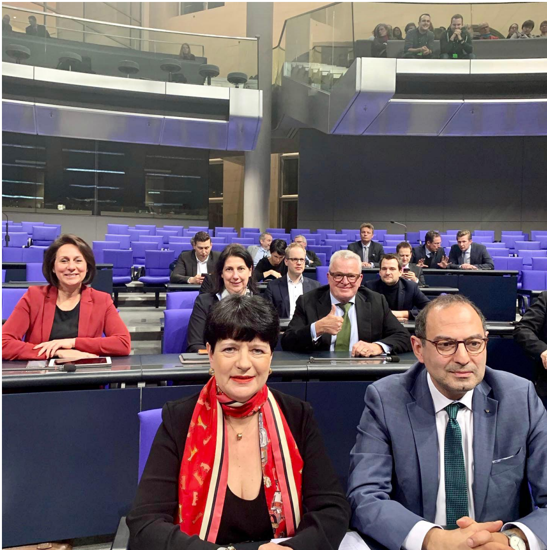
Im Plenum auf den FDP-Bänken. Oben Besuchertribüne