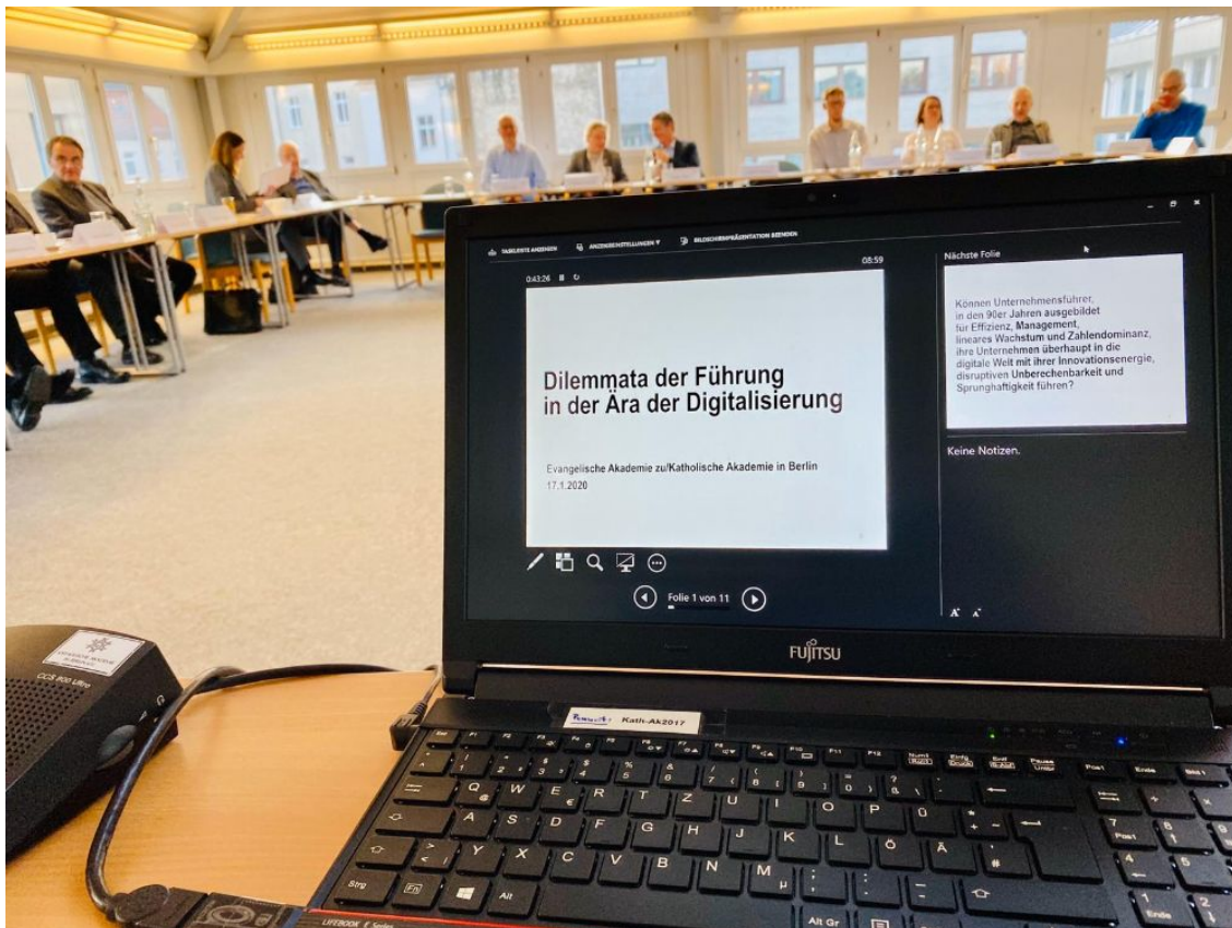
Mein Vortrag für die Katholische und die Evangelische Akademie Berlin am Freitag

Unternehmenskultur: Fluch oder Segen? Das fragen Evangelische und Katholische Akademie in Berlin heute Morgen auf ihrem 18. Forum für Ethik in Wirtschaft und Politik . Mein Thema heute: Dilemmata der Führung in digitalen Zeiten , verlinke gerne meine Powerpoint-Präsentation.