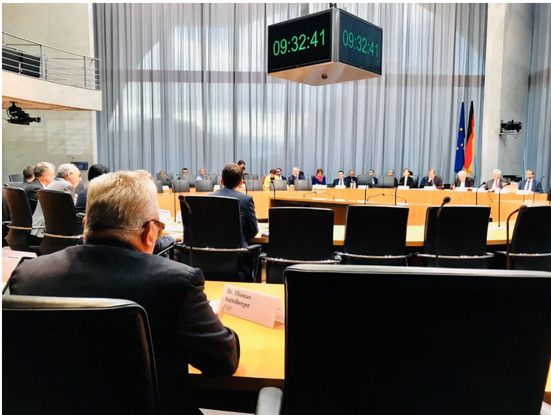
Bei der Anhörung im Bildungsausschuss. Fahnen und Uhr haben Haltung angenommen. Ich auch, aber im Sitzen