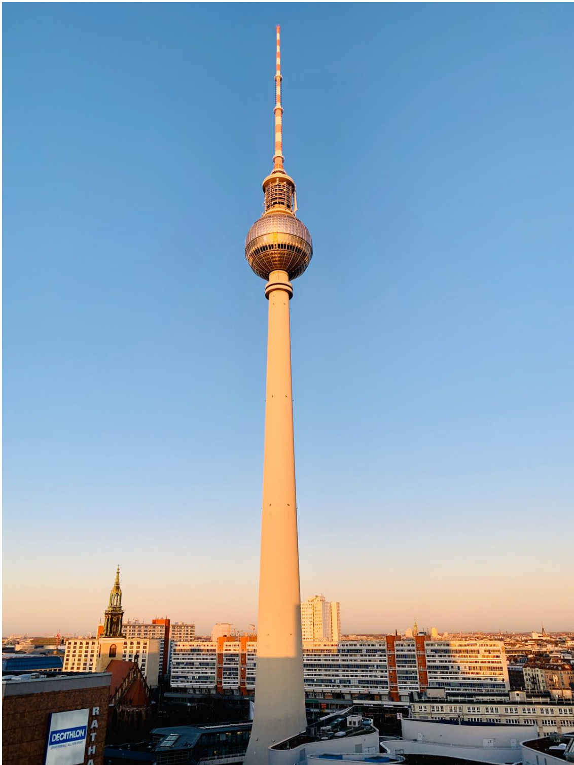
Der Fernsehturm am Alexanderplatz in der Berliner Morgensonne