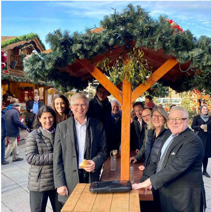
Adventspunsch mit der Landesgruppe

Die Fraktionsgremien schwelgen heute adventlich in Schwester- und Brüderlichkeit im Glanze des kommenden Christkinds. Das dürften sich so nur wenige Unternehmen erlauben. Politik erstickt in der adventlichen Krippe, zuerst im nach Zimt und Spekulatius duftenden Frühstück der Arbeitsgruppe. Dann kurzer Marsch der FDP-Landesgruppe Bayern mit allen Berliner Mitarbeitern auf den Weihnachtsmarkt am Bahnhof Friedrichstraße. Lebkuchen, Kartoffelpuffer, Bratwürste. Als Guter Hirte führe ich mein hungriges Team zum Futtertrog und danach auf die Glühweinweide. Abends Fraktionsweihnacht. All diese kontemplativen Segnungen ausgerechnet in einer der hektischsten Woche des Jahres. Empfinde das eher als Belastung denn als Präsent. Wir stehen es gemeinsam durch. Dieses Jahr bin ich feige, nächstes Jahr leiste ich Widerstand.