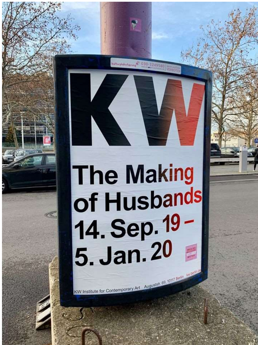
Was es in Berlin alles gibt!

Außerdem treffe ich hier auf meinen früheren CEO René Obermann , der leidenschaftlich wirbt für deutsch-französisches und europäisches Alignment in der Internet Economy. René ist designierter Aufsichtsratschef von Airbus . Herzlichen Glückwunsch! Die Telekom hat lange nach Obermanns Ausscheiden von seinem innovativen Wirken profitiert . Heute steht der Bonner Konzern für Mergers statt für Innovation . Gruß an Tim Höttges.