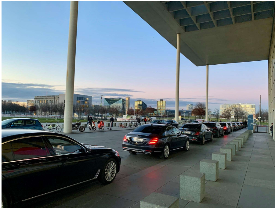
Blick vom Paul-Löbe-Haus auf den Hauptstadt-Bahnhof