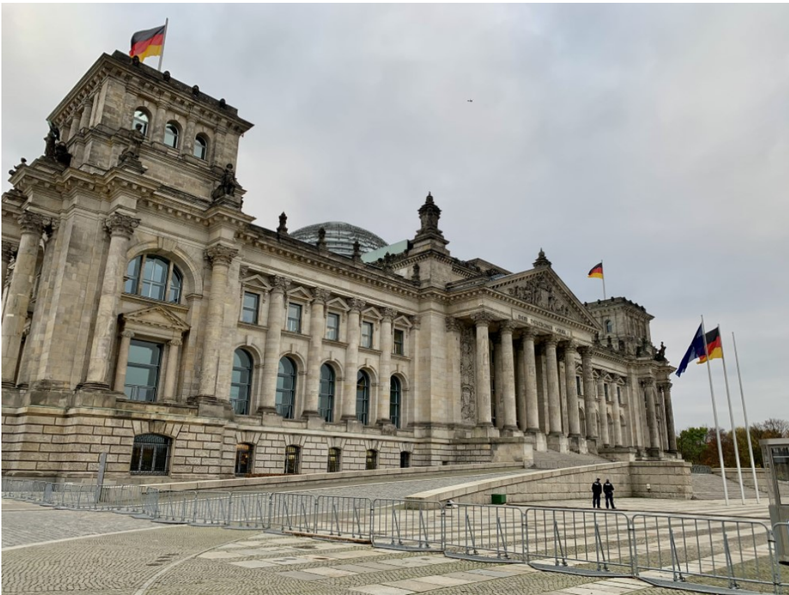
Reichstag im Corona-November 2020

Aus dem muffigen Airport schnell in die behäbige Enquete-Sitzung: Projektgruppe 6 zum Thema Abschlussbericht Zu- und Übergänge in der beruflichen Bildung . Meine Gedanken dazu habe ich in mehreren notiTSen schon erläutert : in den derzeit nichtsnutzigen Dschungel der Übergangsmaßnahmen gehört eine breite Reformschneise . Mein Konzeptpapier (wer es vorher lesen möchte: gerne melden) fließt voll ein. Birke Bull-Bischoff von den Linken hingegen scheitert bislang mit ihrem Ansinnen , eine sogenannte "Ausbildungsgarantie" wie in Österreich im Bericht zu verankern. Denn wir haben im Austausch mit vielen Experten herausgearbeitet: das Etikett "Garantie" ist leider Kosmetik - auch in felix Austria .