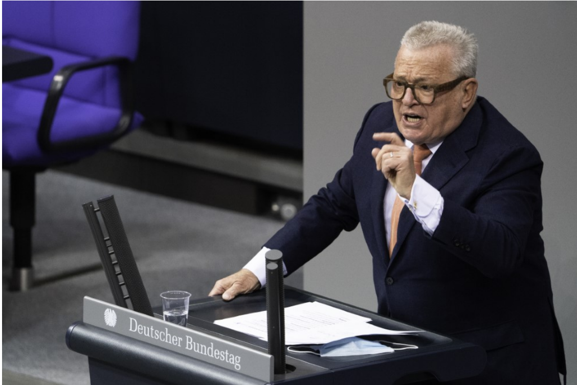
Bei meiner Prime-Time-Rede am Donnerstag über Innovation und Forschung