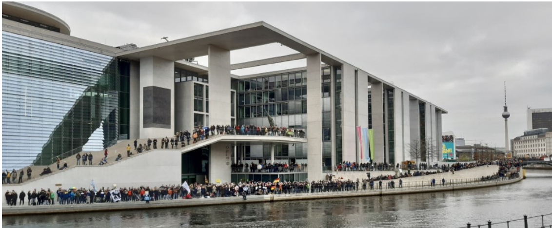
Das von Demonstrantinnen und Demonstranten umsäumte Bundestagsgebäude Marie-Elisabeth-Lüders-Haus

Um den Reichstag und ums Brandenburger Tor herum heute wohl beispiellose Proteste gegen die Novellierung des Infektionsschutzgesetzes . Die Polizei beschützt uns gut . Nichts machen kann sie allerdings gegen die von AfD-MdB in den Bundestag eingeschleusten "Gäste" , die Minister und Abgeordnete in den Gängen bedrängen, belästigen und beleidigen .